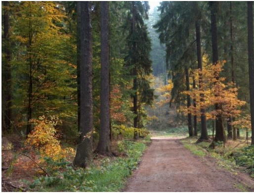
Natura Parko de Książ

* Promenado tra Książański Park Krajobrazowy (natura parko de Książ), i.a. supreniro al loko, ekde kiu oni povas admiri la plej belan panoramon de la Kastelo Książ.