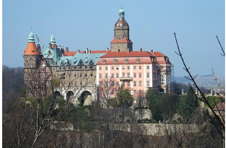
Kastelo de Książ