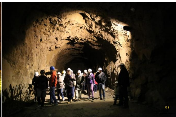
Subtera urbo de Osówka

* Forveturo el Osówka kaj reveno al Wrocław.